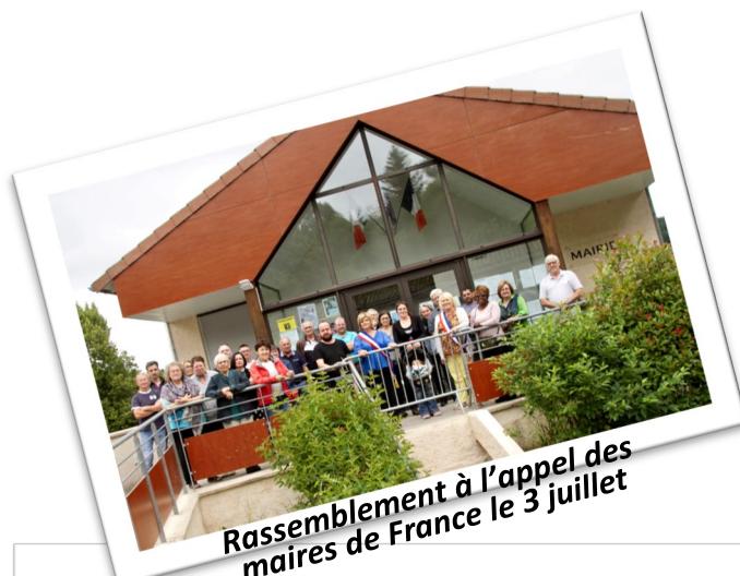
Rassemblement à l'appel des maires de France le 3 juillet