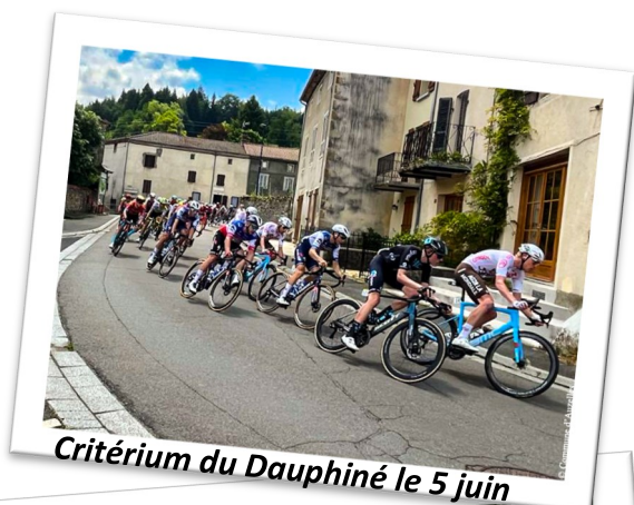
Critérium du Dauphiné le 5 juin