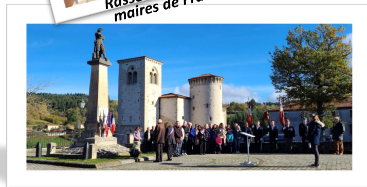
Commémoration du 11 novembre