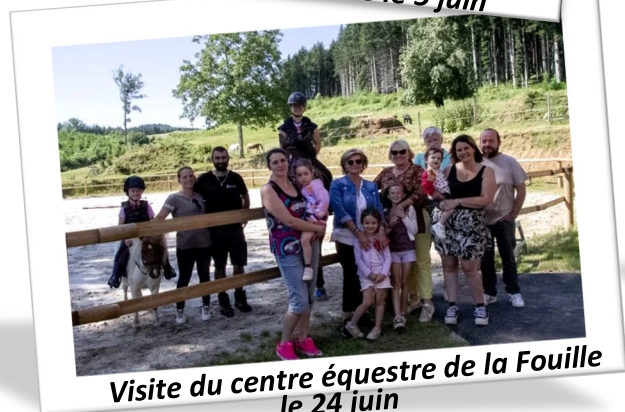
Visite du centre équestre de la Fouille le 24 juin