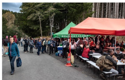
Buvette de la Ganille