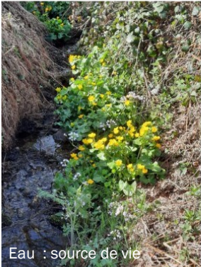
Eau : source de vie

Actuellement, nous travaillons à l'organisation d'une réunion d'information et d'échanges où nous présenterons un film documentaire traitant de la problématique de gestion des biens communs (à travers la France). Les habitants de notre territoire (dont les membres des sections et les élus) seront invités et pourrons participer. Dès que nous serons prêts, nous enverrons une invitation à chacune et chacun.