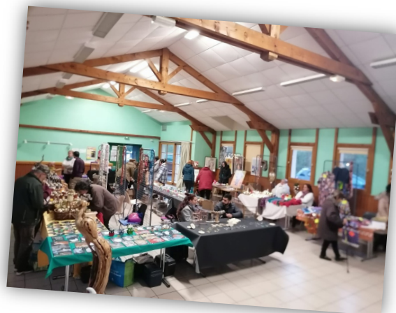
Marché de Noël du 2 décembre 2022