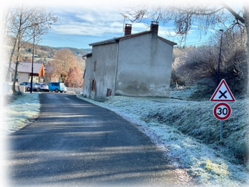
Limitation Bourg 30 km/h

Installation d'un garde-corps sur la toiture des toilettes publiques.