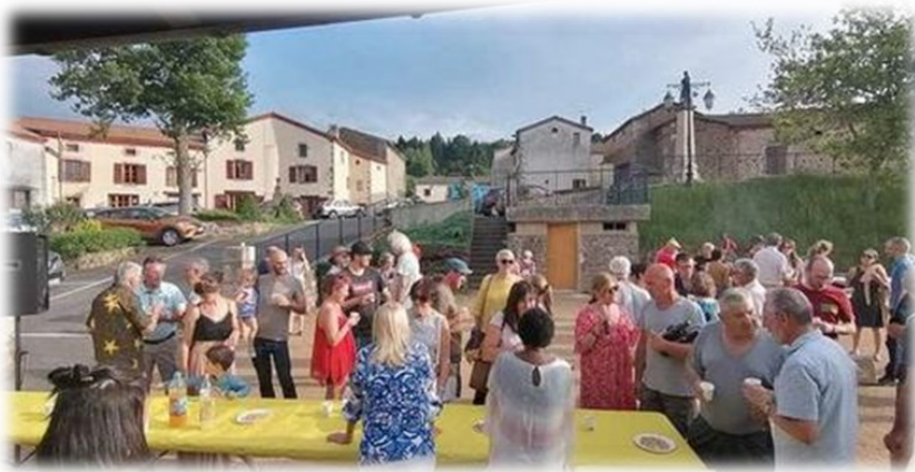
Accueil des nouveaux habitants