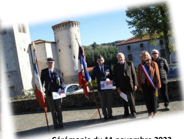
Cérémonie du 11 novembre 2022