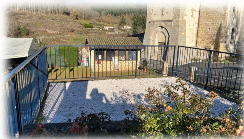
Garde-corps des toilettes publiques