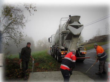
Socle béton pour les bacs