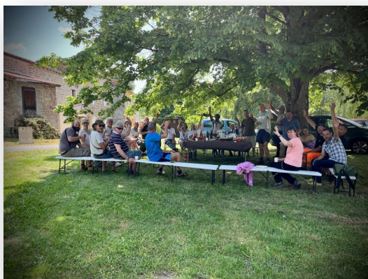
Pique-nique du chantier participatif du 21 mai