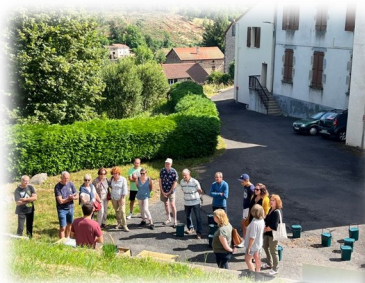
Formation par le service déchets

Des composteurs collectifs ont été installés derrière les logements municipaux et sur le point tri du cimetière.