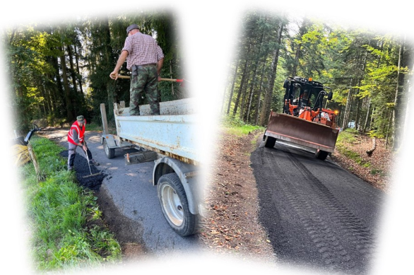
Enrobé à froid

Les employés communaux ont utilisé 17 tonnes d'enrobé à froid pour l'entretien de la voirie.